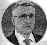
Андрей Бронц Министр сельского хозяйства Приморского края