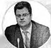
Никита Кузнецов Директор Департамента развития внутренней торговли Минпромторга России