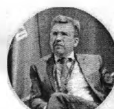
Владлен Максимов Президент Ассоциации малопылевой торговли России