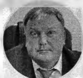
Сергей Калитин Министр промышленности и торговли Приморского края