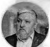
Игорь Бухаров Президент Федерации Рестораторов и Отелиров России